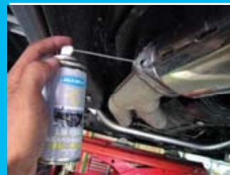
エキゾースト系ボルト