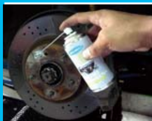
ハブボルトへの使用