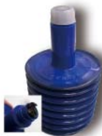
LM-0501 等速ジョイントグリース