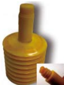
LM-0521 等速ジョイントグリース