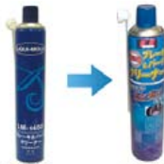
LM-1403 840ml DM-007 850ml

ご愛用頂いておりました LM-1403 は DM-007 に 生まれ変わりました